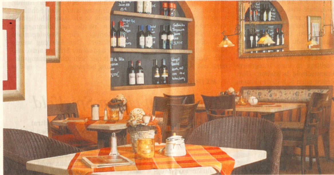
Blick in die Innenräume des umgebauten Hotels Maarblick.