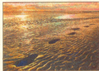
Das Wattenmeer fasziniert seine Besucher immer wieder.

werden Unterhaltung, Information und Geschichte auf eine besondere Weise miteinander verknüpft. In unmittelbarer Hafennähe befindet sich das beeindruckende Ge-