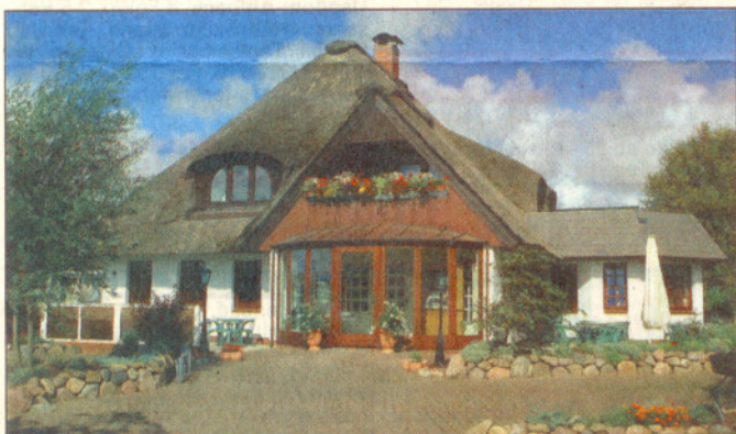
Reetdachromantik: das Hotel Wiesengrund.

Info und Buchung: Landidyll Hotel Insel Büsum & Wiesengrund, Tel. 04834/96 23 00, Fax -/96 23 01, E-Mail: hotel-insel-buesum@landidyll.com, Internet: www.landidyll.com/hotel-insel-